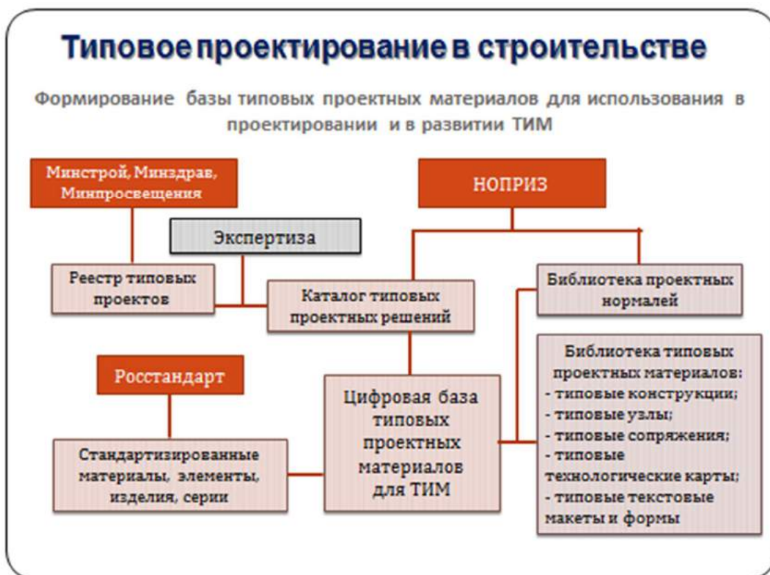
Рисунок 2.2 – Структура базы типовых проектных материалов, необходимых для применения информационных технологий в проектировании

Участие Объединения в развитии стандартов, форматов и технологий информационного моделирования в сфере архитектурно-строительного проектирования и оформления материалов инженерных изысканий.