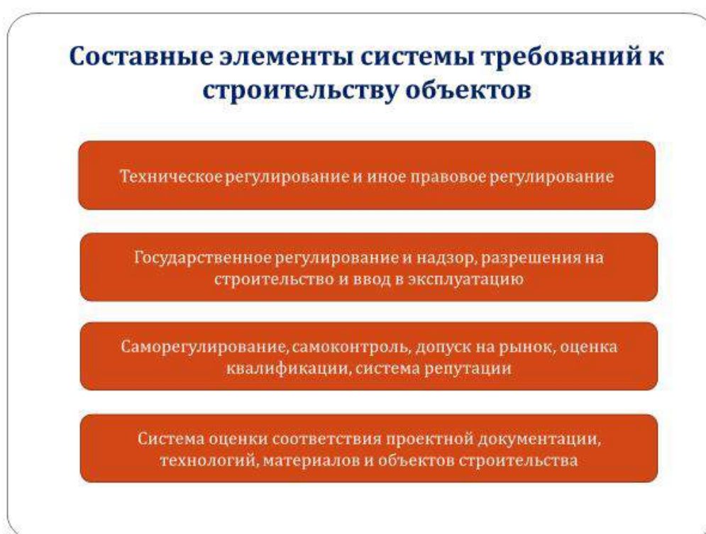
Рисунок 3.1 – Структура системы требований к капитальному строительству

Система требований к объектам капитального строительства (рис.3.1) – основной механизм обеспечения качества и безопасности этих объектов, закладываемых в проектную документацию и реализуемых в процессе строительства.