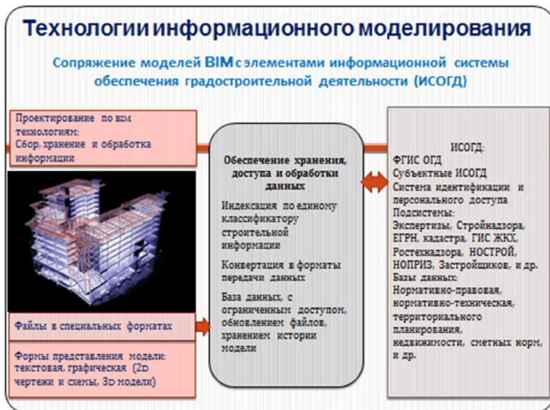
Рисунок 2.3 – Принципы сопряжения моделей BIM с элементами информационной системы обеспечения градостроительной деятельности

основой системы управления жизненным циклом объектов недвижимости. Вариант принципиального подхода к такому сопряжению представлен на рис. 2.3.