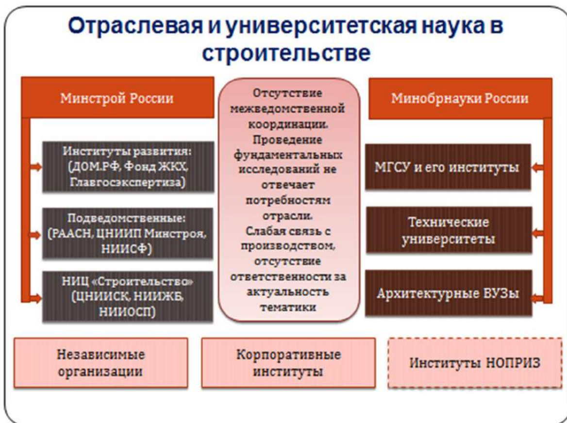
Рисунок 4.2 – Структура отраслевой науки в строительстве

Кроме того, образовательные учреждения могут явиться связующим звеном между профессиональным сообществом и академической наукой (рис.4.2), в частности, отдельные подразделения ВУЗов могут использоваться Объединением в качестве элементов профессиональной инфраструктуры.