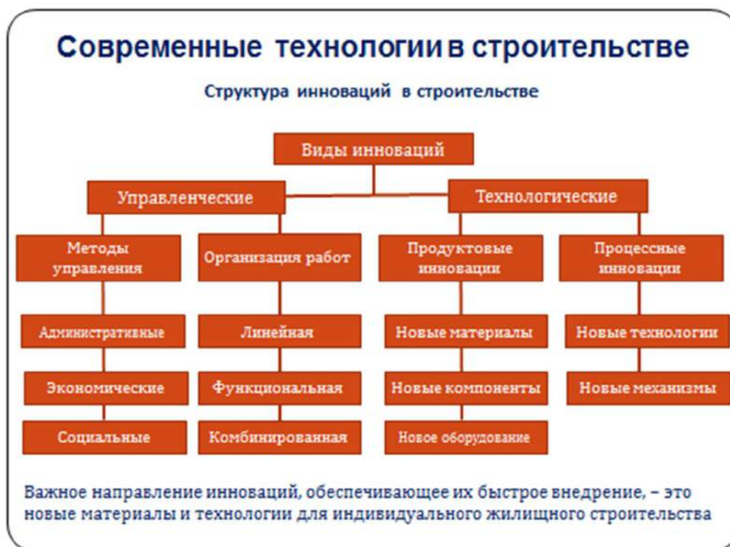
Рисунок 5.2 – Основные направления инноваций в строительной сфере

организациях и обязательным обучением, и последующим внедрением системы менеджмента качества в организации.