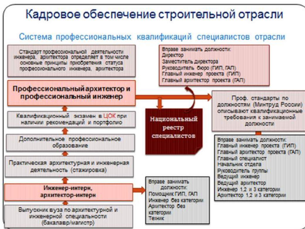
Рисунок 5.1 – Схема профессиональных квалификаций в сфере проектирования

В целях реализации предложенной системы целесообразно разработать программу введения многоуровневой квалификации в сфере инженерных изысканий и архитектурно-строительного проектирования.