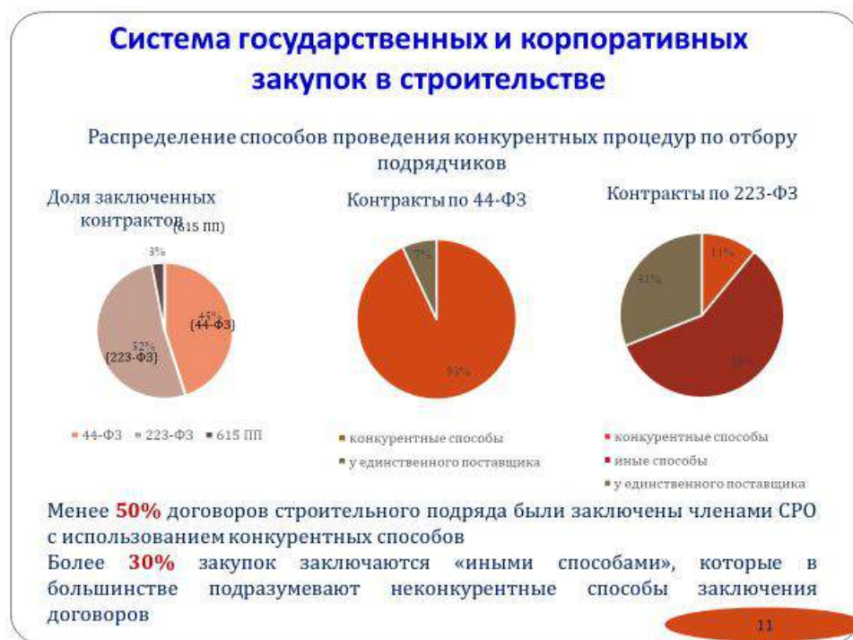
Рисунок 2.5 – Способы проведения конкурентных процедур по отбору подрядчиков в строительстве

В составе работ по совершенствованию контрактной системы ПИР могут рассматриваться: