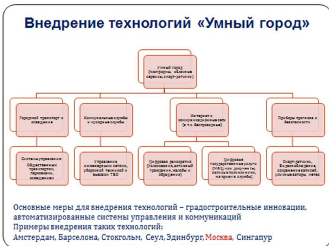
Рисунок 4.1 – Технологии стандарта «Умный город»

советов при министерстве. Планирование различных мероприятий Объединения, требующих использования средств сметы НОПРИЗ, как правило осуществляется на основании письменного одобрения или согласия министерства. Одним из возможных направлений взаимодействия представляется комплекс мер по внедрению стандарта Минстроя России «Умный город», мероприятия которого включены в проект Стратегии развития строительной отрасли (рис.4.1)