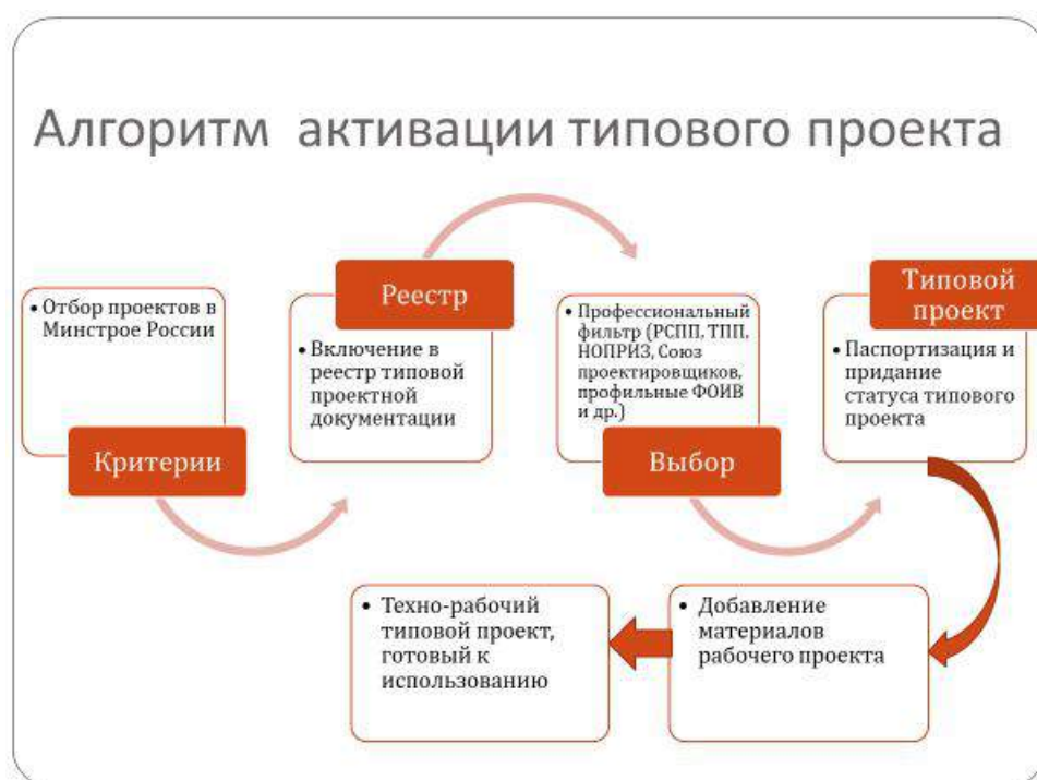
Рисунок 2.4 – Алгоритм формирования типовой проектной документации

Кроме того, реализация данного предложения даст толчок развитию системы типового проектирования, имея в виду подготовку не проекта на стадии "П", требующую дополнительных финансовых и временных затрат на его привязку и разработку рабочей документации, а техно-рабочего проекта, включающую проектную и рабочую документацию.