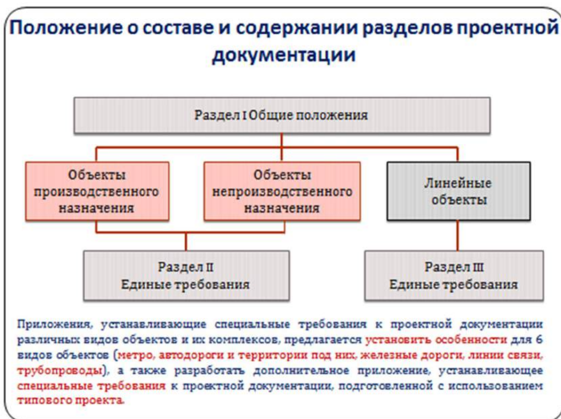
Рисунок 3.2 Предлагаемая структура Положения о составе и содержании проектной документации

- на третьем этапе рассмотреть предложения по каждому разделу ПД с привлечение профессиональных пользователей соответствующих разделов, имея в виду снятие административных барьеров, исключение дублирующих функций, переход на электронный способ подготовки и представления проектной документации, в том числе с применением технологий информационного моделирования;